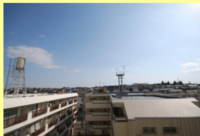
南側バルコニー眺望