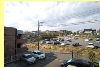
北側バルコニー眺望